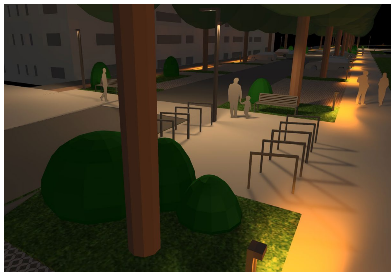
Pers 4

en périphérie par des bornes basses et jalonné de lampadaires pour les traversées et parcs à vélos. L'éclairage cheminements piétons sera privilégié, laissant la chaussée dans une semi-obscurité (en cohérence avec la stratégie cantonale OptimaLux appliquée sur les routes de Veyrier et de Vessy). L'esplanade Jean Piaget sera quant à elle ponctuée par des halos lumineux depuis des mâts multi-projecteurs, alternant ainsi des zones éclairées et d'entre-deux.